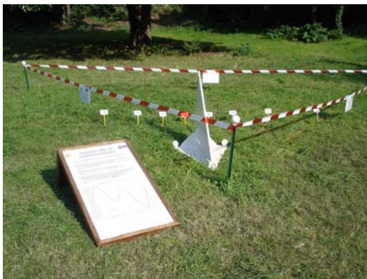
Le cadran solaire et son mode d'emploi.