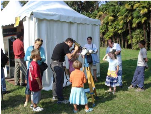
L'observation solaire sans risque