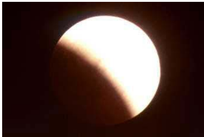
Fig. 2: Photographie d'une éclipse de lune.